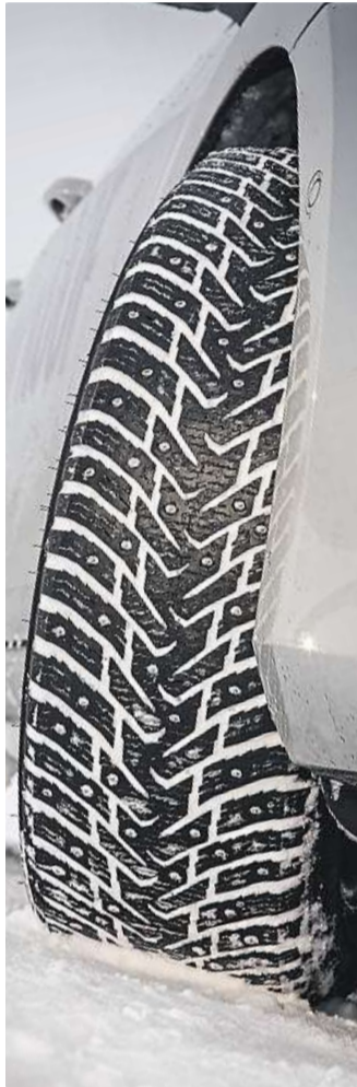
Na sněhu Zákon vyžaduje vyjízdu na sněhu jen na zimním obutí.

Pokud budou za příčinu škody jednoznačně označeny letní pneumatiky, může pojišťovna krátkit pojistné plnění. Z povinného ručení viníka pojišťovna poškozenému ško-